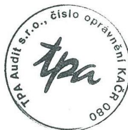
TPA Audit s.r.o. Antala Staška 2027/79, Praha 4 číslo oprávnění 080 KAČR